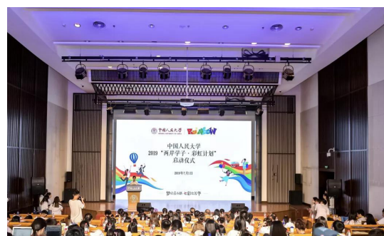
P10 2019“两岸学子·彩虹计划”启动仪式顺利举行