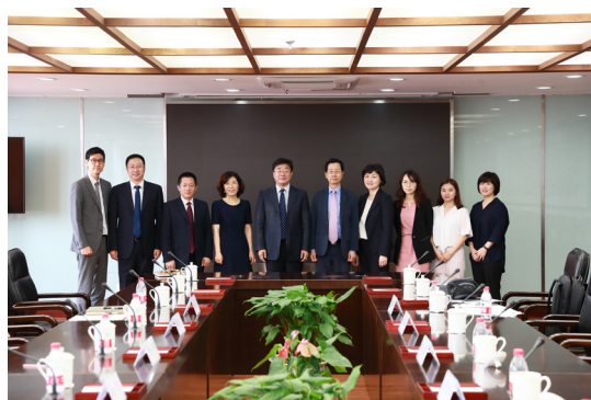
P05 韩国高等教育财团事务总长朴仁国率团访问中国人民大学