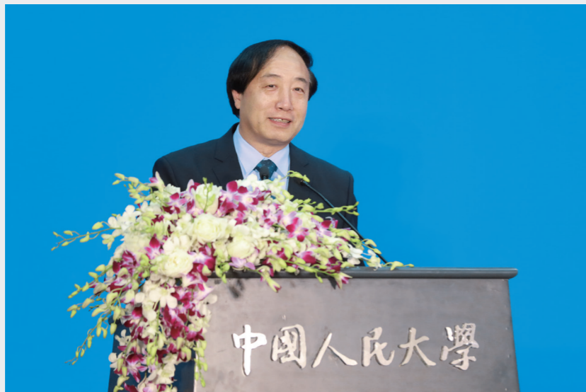
中国人民大学副校长 | 杜鹏 教授