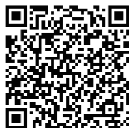
亚洲学校详情 及网址请扫码查询

特拉维夫大学简称为TAU，是以色列规模最大的国立综合大学，校址位于以色列第二大城、第一大都会之心 - 特拉维夫。特拉维夫大学是多个机构、论坛及中心的基地，设有多个学科，而且十分重视基础和应用科学的研究。该大学还拥有专门的研究所，主要从事战略研究，医疗保健系统管理，技术预测和能源研究等。