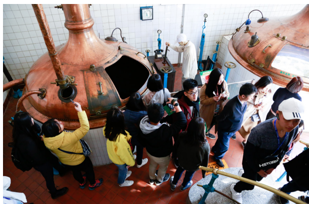
▲ 港澳台交换生“知行齐鲁”参访团参观青岛啤酒博物馆。

港澳台交换生文化体验活动是港澳台办公室结合港澳台交换生思想行为特点，为交换生们量身定制的系列活动。截至目前，港澳交换生已经在港澳台办公室的组织下前往西安、上海、苏州、青岛等地进行体验学习。活动通过社情调研、机构参访、文化交流、技艺研习等方式，帮助交换生增进对灿烂中华文明和厚重中华历史的认识与理解，提升交换生对改革开放伟大成就的感受与体会，不断加强我校对港澳台交换生群体的服务、支持和辅导工作。