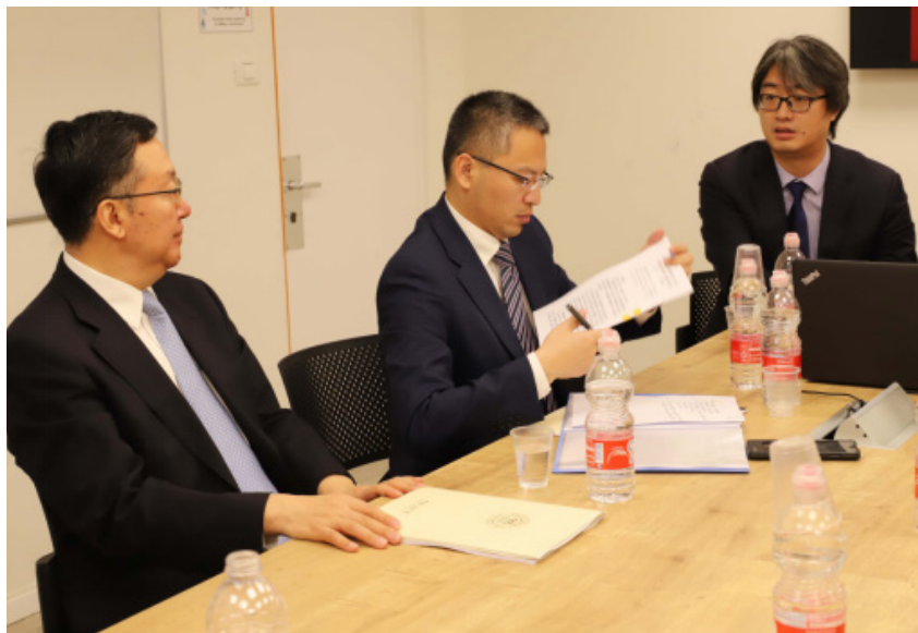
▲ 教育部副部长田学军考察以色列特拉维夫大学孔子学院。

10月25日，教育部副部长田学军访问希伯来大学，并考察希伯来大学孔子学院。期间，田学军听取了特拉