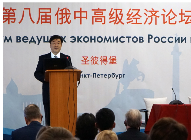
▲ 刘伟校长出席中国人民大学和圣彼得堡国立经济大学共同举办的第八届中俄高级经济论坛并在开幕式致辞。

圣彼得堡国立经济大学是俄罗斯公认的最好的财经类教学与研究的中心，同时也是俄罗斯最大的经济科研中心之一，向政府、议会、圣彼得堡管理机构提供咨询服务，与企业界也有着密切的合作。近年来，中国人民大学与圣彼得堡国立经济大学等俄罗斯高校从学者互访到合作研究，从联