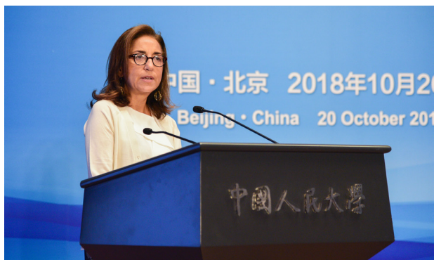
▲ 欧盟委员会教文总司长赛米丝·克莉斯托弗在会议开幕式上致辞，表示中欧人民在文化、教育领域求同存异、合作互利，进一步加深了人文对话和对彼此的了解。

张晋在欢迎辞中表示，在中欧高级别人文交流合作机制作用下，中欧双方不断推进合作，形成了大量丰硕成果。希望双方专家学者充分利用高等教育合作平台，促成更多