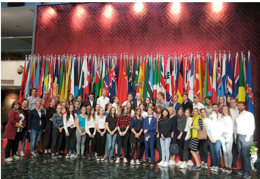
▲ 德国莱比锡大学孔子学院中学生团访问国家汉办。

此次秋令营旨在加深德国青少年对中国文化的了解,提高他们的汉语水平,增进中德两国青少年之间友谊。